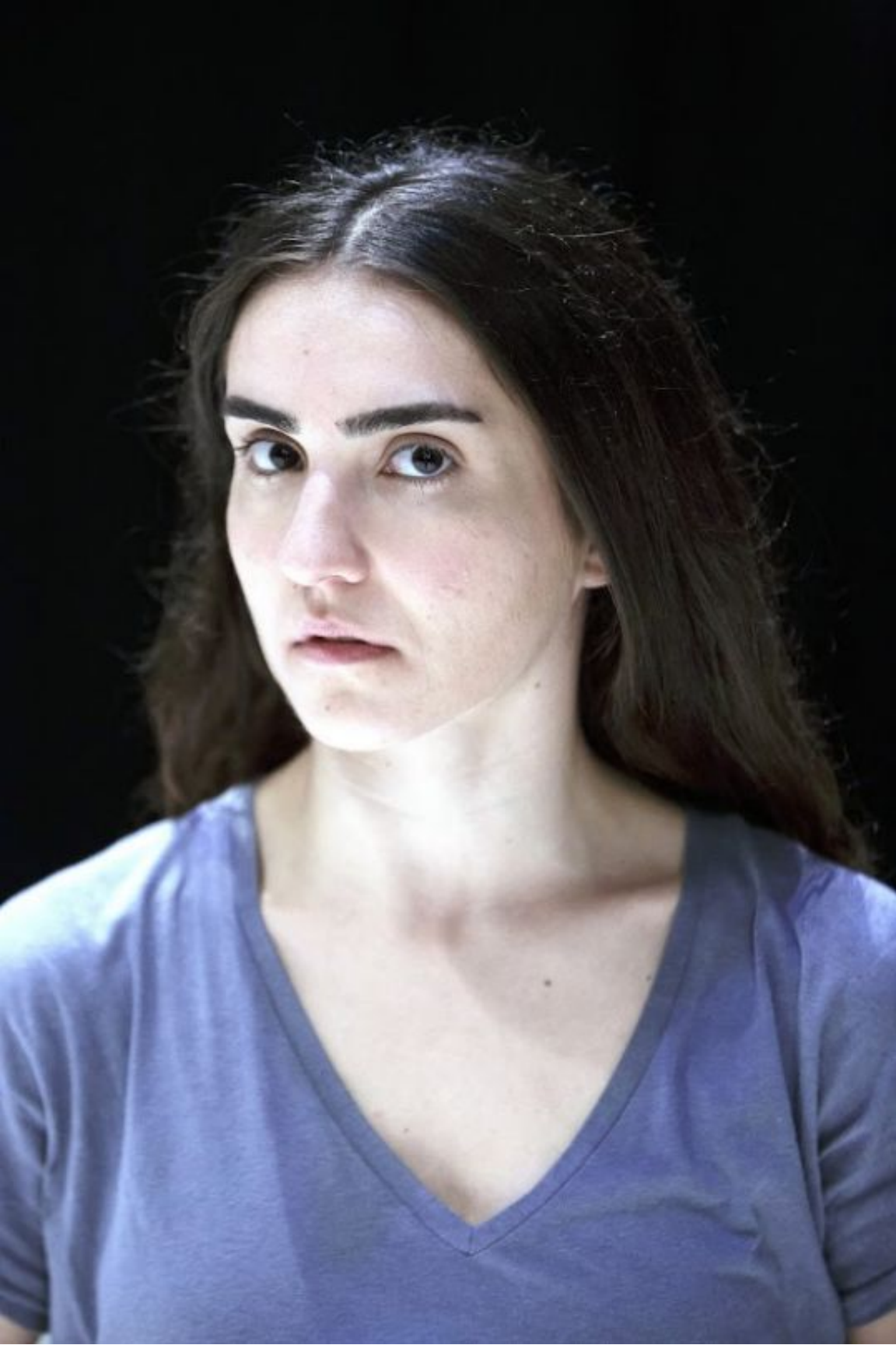
8th Gdansk Solo Dance Contest, Polonya

_Hukuk okuduğunuzu biliyorum, etik, işçi hakları ve sorunları, belki feminizm vs... İşlerinizde bu temaların etkisinin biraz hukuk okumanızdan kaynaklandığını söyleyebilir miyiz?