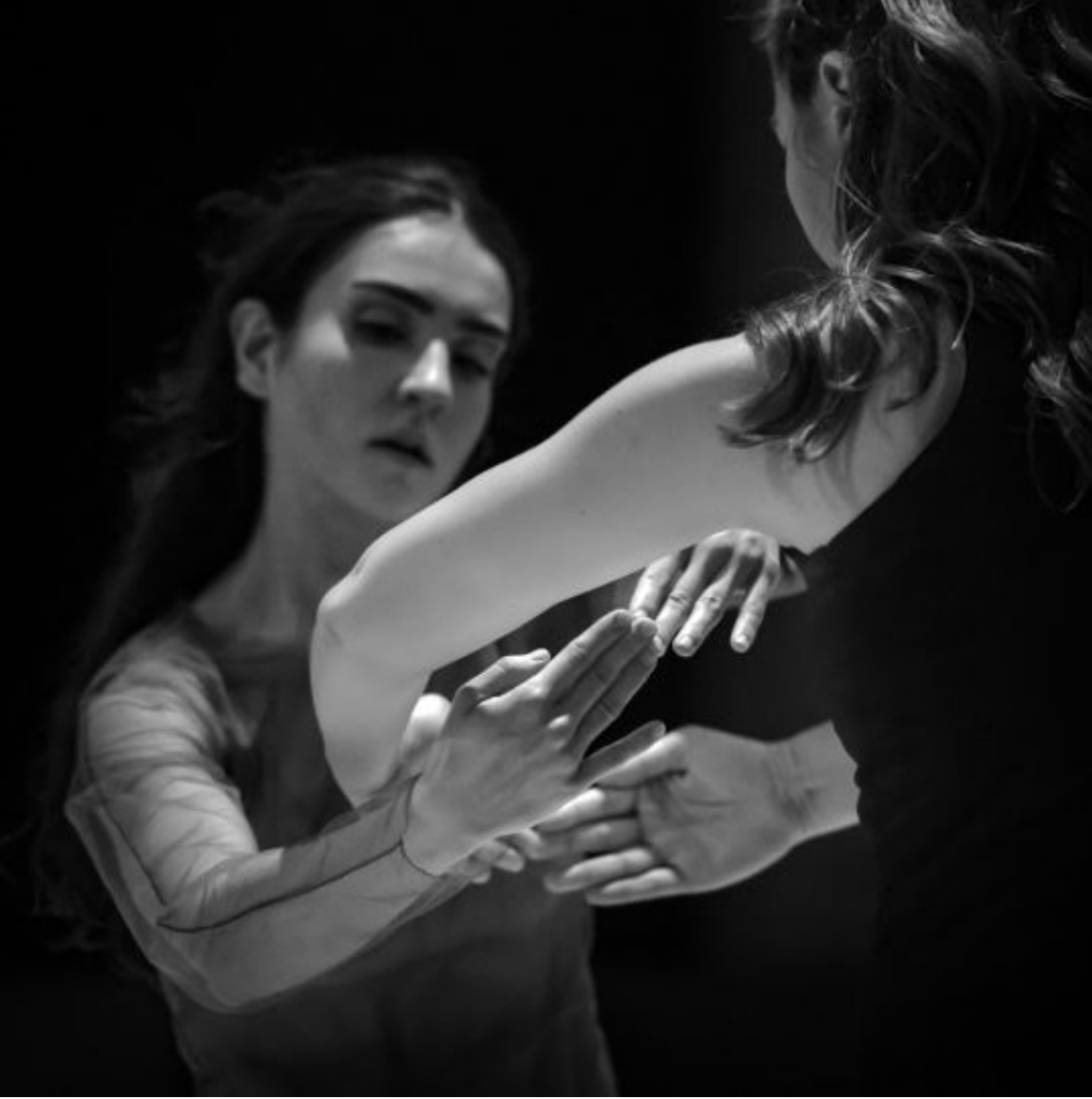
"Epimeleia Heautou" @20. İstanbul Tiyatro Festivali

Kendimle kalmaktan sıkıldım. Şimdi Akbank Sanat'da gösterilecek olan Bengi Sevim'in koreografisi için 4 dansçı birlikte çalışıyoruz. Birlikte hareket etmek hoşuma gidiyor.