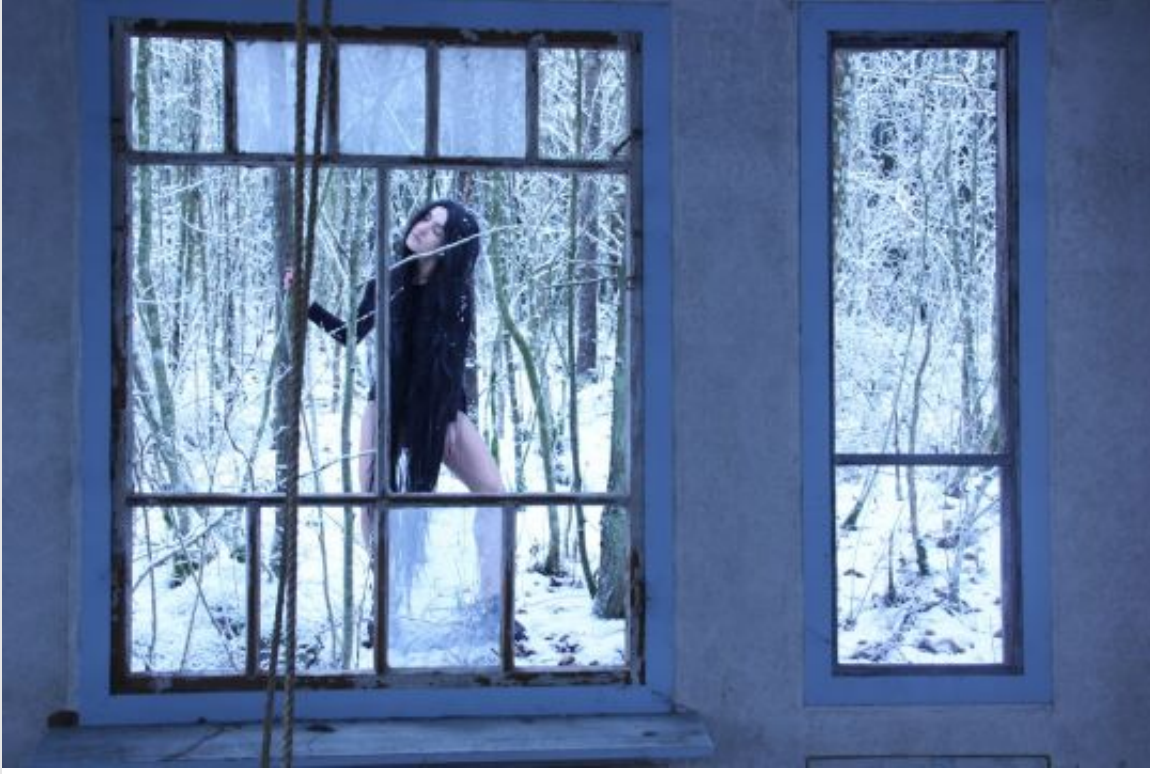
"Madam Moth" @ Saari Residence, Finlandiya

_Bir koreografiye başlamanız ve bitirmeniz arasındaki süreçten biraz bahsedebilir misiniz? Aklınıza gelen konseptin ardından ilk olarak neler yapıyorsunuz örneğin, kullandığınız müzikleri nasıl seçiyorsunuz?