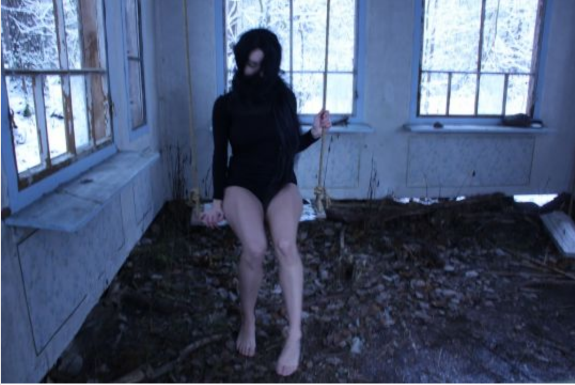
"Madam Moth"@ Saari Residence, Finlandiya

Her üç kadın karakter de kusurlu arzularının kurbanı. Bu üç karakterin kusurlu arzuları, kötü tarafları, gelenek dışı eylemlerinin ile fiziksel olarak "var oluşu" bu eserin temeli. Örneğin benim yorumumda Kraliçe, kötücül cücesi tarafından öldürülmez, onu kendi bedeninde eritir ve ona dönüşür. Cücesinin fiziksel kusurları, kendi gücü ve iktidarı, kötücül yanı ile var olmaya devam eder. Güzellği şeffaflıkla, bir başka deyişle "hem var hem yok" bir varoluşla tanımlanan Pohjan Neito etten kemiktendir, derisi de kalındır, belki de siyahtır. Madam Butterfly, intikam için geri gelir, artık kelebek değil güvedir, Batılı olma arzusu ile kalbinin kurbanı olmaz, ona hükmeder. Bu kadın karakterler koreograf ve icracısına çarparak şekil değiştiriyor. Karakterlerin gerçekliği, koreograf ve icracısının; yani benim kendi gerçekliğimin süzgecinden geçiyor. Her üç solo ile birlikte, idealize edilmiş farklı kadın prototiplerini sorgulayarak bu özelliklerin hiçbirini taşımayan "öteki" nin varoluş biçimini, Batı'ya özgü tekil bir form olan "solo" ile gözler önüne seriyorum.